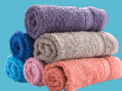
LINGE DE MAISON