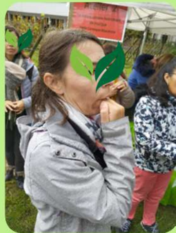
Replier la main en fermant le poing, souffler et... beaucoup s'entraîner!