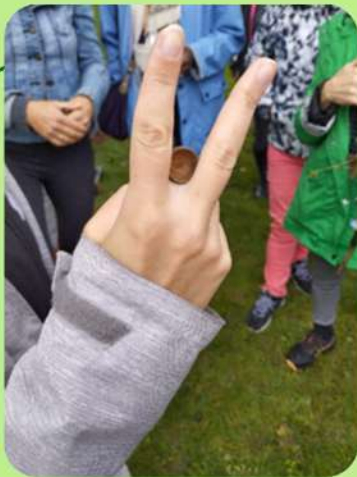
Mettre la cupule entre son index et son majeur, au plus près de la paume de la main

Siffler avec la cupule d'un gland de chêne