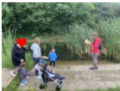
Hirtzfelden—Maison de la Nature